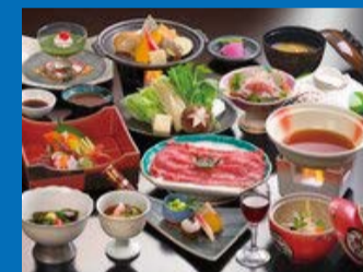
ボリュームたっぷりの豪華夕食(参考)

宿泊代 + リフト券 + 貸切バス + 傷害保険 + 朝夕食各2回 すべて込み!